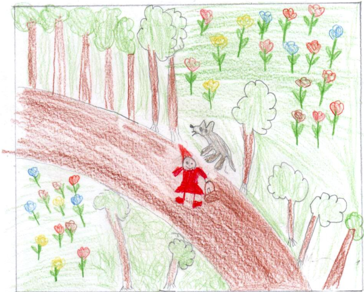
Rotkäppchen trifft auf den Wolf.