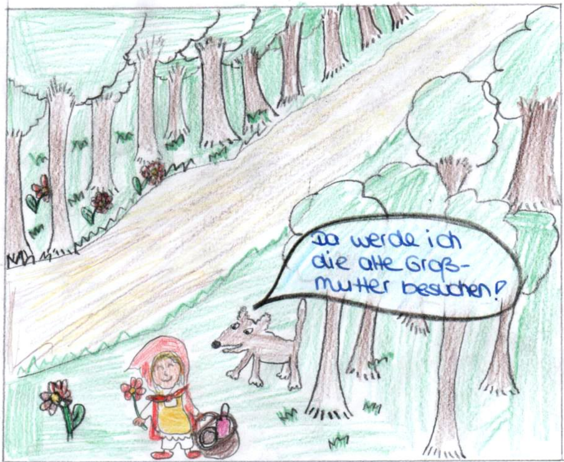
Rotkäppchen pflückt Blumen. Wolf geht weiter.