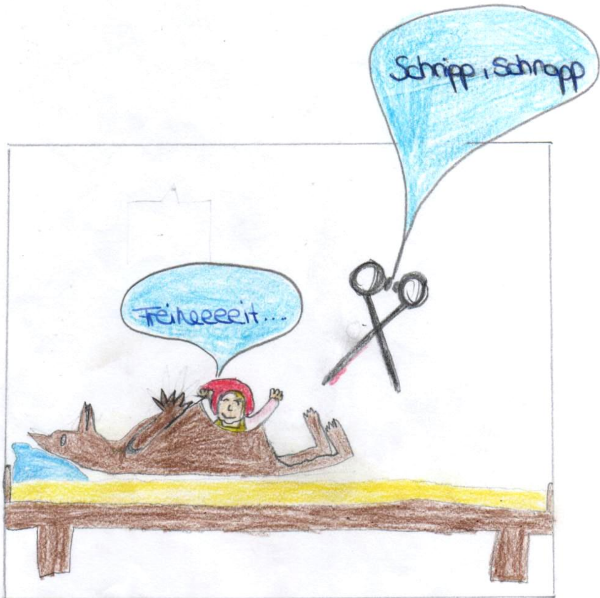
Jäger schneidet den Zaun auf und rettet Großmutter und Rotkäppchen.