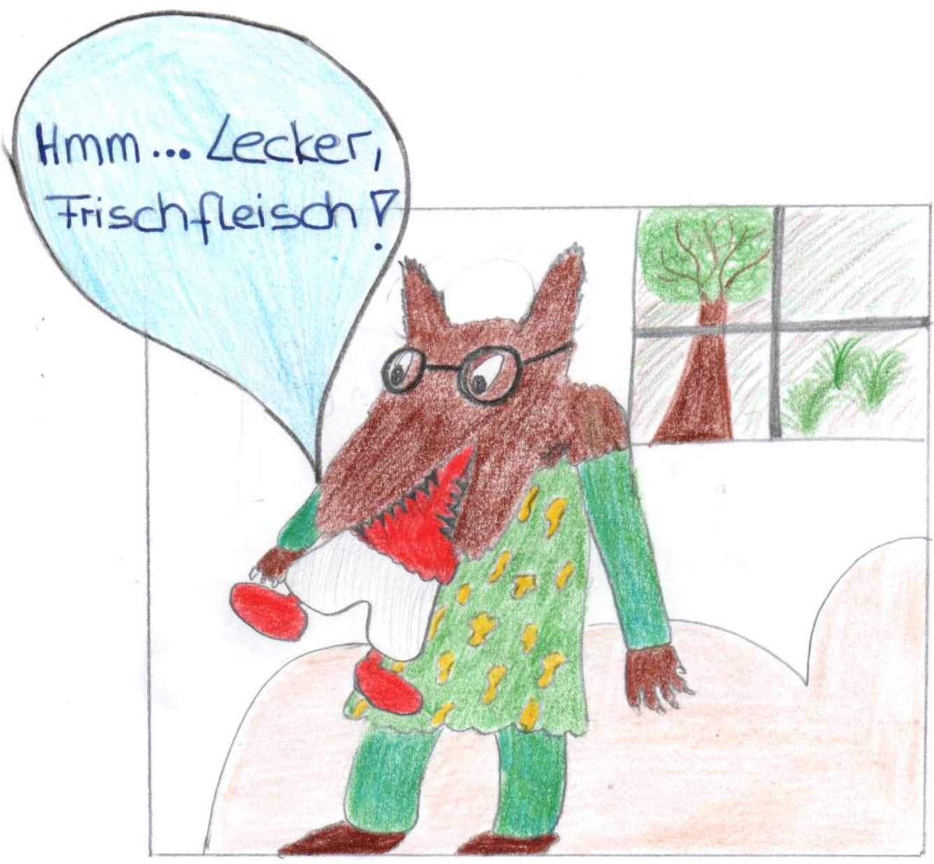
Wolf frisst Rotkäppchen auf