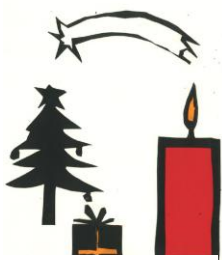
Simon Wirries, 7B

Allen wünsche ich eine erholsame und ruhige Weihnachtszeit. Genießen Sie die freien Tage zu Hause, im Schnee oder auf einer fernen Insel und kommen Sie gut im neuen Jahr 2017 an!